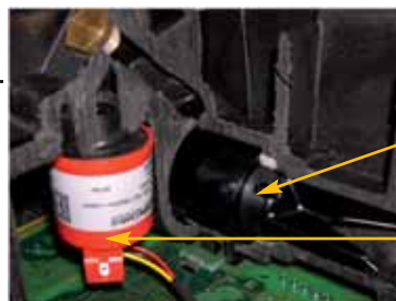
Capteur de débit