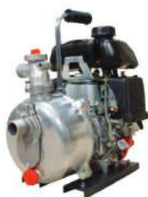
TEF 25 HA