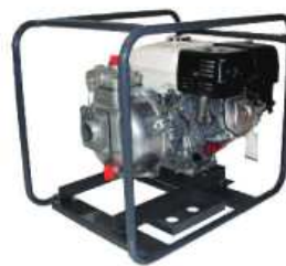
TEW2 50 HA