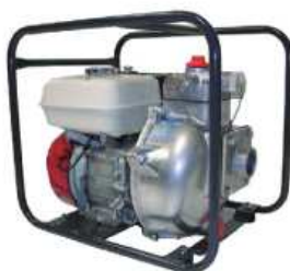
TEF3 50 HA