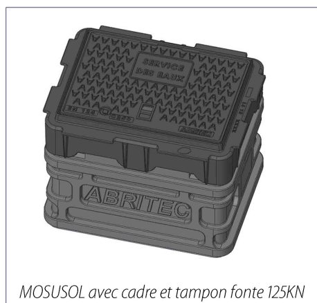
MOSUSOL avec cadre et tampon fonte 125KN