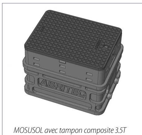
MOSUSOL avec tampon composite 3.5T

Le cadre de remise à niveau offre une amplitude de réglage de 100mm au niveau du sol fini avec une inclinaison de 5°. Il comporte une semi articulation du tampon qui permet son maintien en position ouverte.