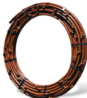
Collecteur de goutteurs en ligne QF