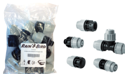
Raccords compatibles XQF