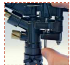
Déverrouillage simple du secteur de l'irrigation

Buse rayon long (long fourreau) + buse de rayon court