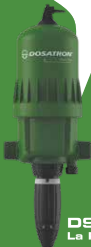
D9 GREEN LINE La Référence Fertigation