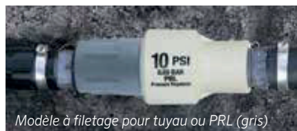
Modèle à filetage pour tuyau ou PRL (gris)